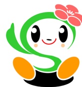
磯子区キャラクター

期間中、施設をまわって4つのスタンプを あつめると景品がもらえるよ！ スタンプを押せる施設など、くわしくは、区 役所やいろいろな施設にある「いそっぴゴー ルデンウィーク」のパンフレットをごらんく ださい。